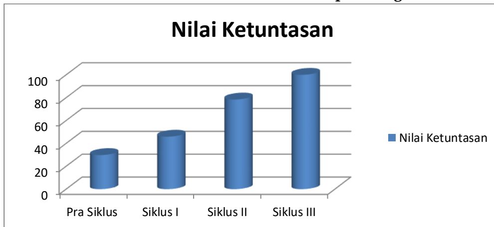
Gambar 2. Nilai Ketuntasan Siswa Dari Pra Siklus Sampai Dengan Siklus III

Dari hasil ketuntasan diatas dapat di jelaskan pada pra siklus 29,8 siswa yang tuntas, pada siklus I meningkat menjadi 45,9 siswa yang tuntas dalam kegiatan pembelajaran Pendidikan Agama Islam pada materi Ibadah Puasa membentuk pribadi yang bertakwa. Pada siklus II tingkat ketuntasan siswa dalam belajar Pendidikan Agama Islam yaitu 78,4 dari Kelas VIII SMP Swasta Tunas Mandiri. Kemudian dianalisis dari siklus III ketuntasan siswa mencapai 100. Dari hasil tersebut dapat disimpulkan bahwa dari pra siklus sampai pada siklus III mengalami peningkatan secara bertahap.