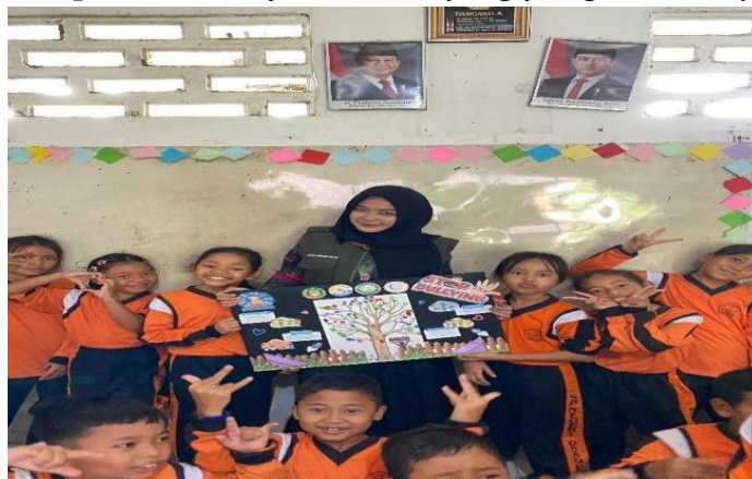
Gambar 5. Pelaksanaan Program

Namun secara keseluruhan, sasaran program dapat dikatakan tercapai dengan baik. Program ini tidak hanya meningkatkan kesadaran siswa terhadap bahaya bullying, tetapi juga membantu memperkuat komitmen sekolah dalam menciptakan budaya anti-bullying yang berkelanjutan.