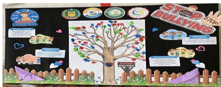
Gambar 4. Mading Anti Bullying

Sekolah dapat mengadakan pertemuan atau sosialisasi berkala untuk memberikan pemahaman kepada orang tua mengenai pentingnya komunikasi positif dengan anak, pendampingan emosional, serta pemantauan perilaku anak di luar sekolah. Masyarakat sekitar, seperti tokoh masyarakat, organisasi pemuda, dan kader lingkungan, dapat dilibatkan dalam kampanye anti-bullying atau kegiatan bersama yang mendukung terciptanya suasana yang aman bagi anak-anak. Sinergi antara sekolah, keluarga, dan masyarakat akan menjadi solusi komprehensif dalam membangun lingkungan belajar yang sehat, inklusif, dan berkarakter.